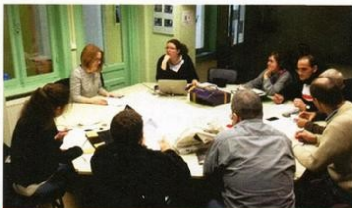
Le groupe des « marcheurs » s'est retrouvé régulièrement

Le parcours a été choisi, le budget établi et puis... les actions de financement ont été imaginées et réalisées : lavages de voitures, témoignages, ventes de « pas » symboliques, demandes de subventions.