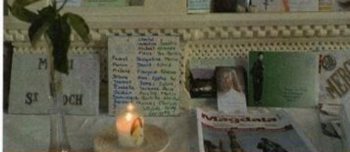
Le long du chemin, un « merci » aux nombreux soutiens