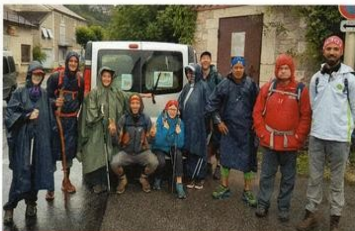
Différents mais unis, fiers d'une si belle aventure !

Cette année encore, notre projet « un peu fou » de constituer un groupe d'horizons différents pour marcher ensemble sur les Chemins de Compostelle a été une réussite. Les Pèlerins 2017 rentrent tous de ce séjour avec une énergie nouvelle pour avancer dans leurs projets. Et si ces Jacquets si originaux, composés de musulmans, bouddhistes, chrétiens et athées, ont pu vivre de si beaux moments, c'est surtout grâce aux nombreux soutiens que nous avons reçus.