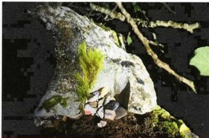
Au creux d'un rocher ont été déposés les cailloux...

Quand l'amitié estompe le doute, Dans un élan de fraternité, On peut alors reprendre la route, Et s'élever en toute liberté.